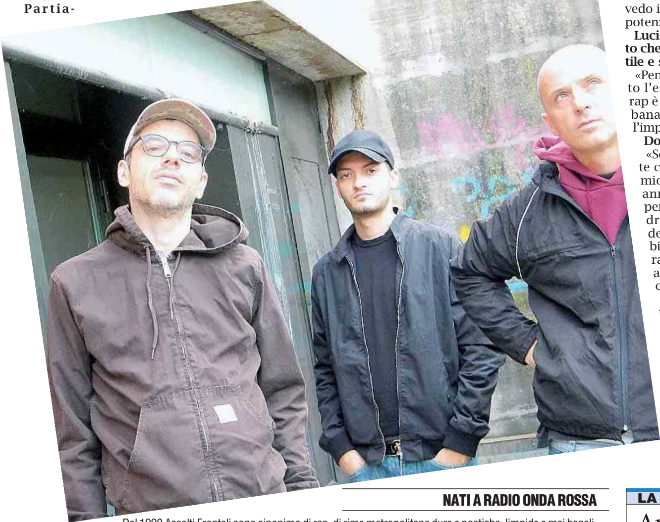
NATI A RADIO ONDA ROSSA