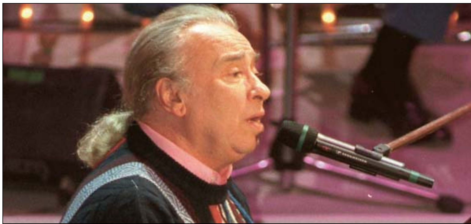
A Umberto Bindi è dedicato il concorso che vedrà giovani talenti in scena da mercoledì a Santa Margherita Ligure. E il 15 il concerto di Finardi