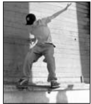
Equilibrismi sul muretto

Da oggi, orario dalle 16 alle 20, sino a domani, dalle 14 alle 20, sotto i portici del palazzo dell'Inps in piazza della Vittoria, lato via Cadorna, gli skate-boys che si esibiscono ogni pomeriggio nella zona, in collaborazione con il Consorzio Agorà e con il Distretto Sociale 8 Medio-Levante, organizzano un'esposizione di fotografie e