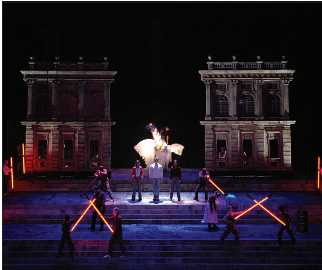
CARLO FELICE Un momento delle prove del «Don Giovanni» che apre la stagione lirica