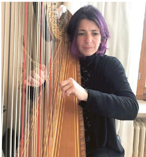
Posso put my harp at your service